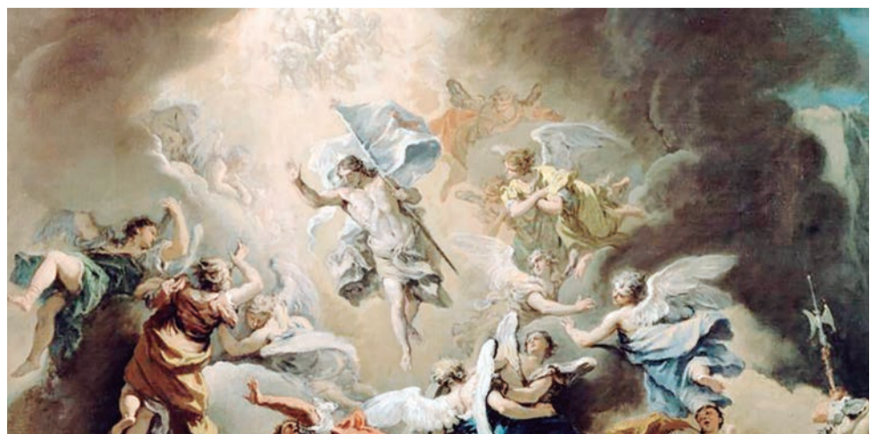
Resurreição (Óleo sobre tela de Sebastiano Ricci)