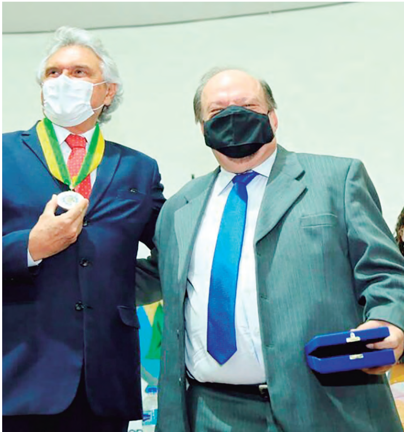
Caiado recebe a Medalha do Mérito Econômico do Corecon: "Garanto a cada um dos economistas que jamais desonrarei esta comenda que acabo de receber. Isso me impõe mais deveres que direitos"