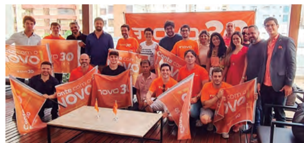
Integrantes do partido NOVO de Goiás reunidos em sua confraternização de final de ano, ocorrida no último dia 18/12

Somos o único partido que não utiliza dinheiro público para financiar campanhas e sempre estaremos do lado do cidadão, que já está cansado de receber a conta dos privilégios para partidos e políticos.