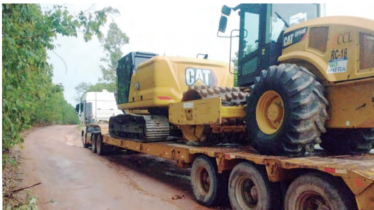
Começam obras de melhoria da rota alternativa à GO-118, no trecho que liga Cavalcante a Colinas do Sul

“Trata-se de um plano de guerra, face à emergência que vivenciamos. A tática foi formulada com a união de todo o corpo técnico da Goinfra”, ressaltou, explicando que, durante o prazo de execução das obras e até o final do período chuvoso, uma equipe de plantonistas vai coordenar os trabalhos, sempre em comunicação direta com os fiscais de campo, para diminuir o desconforto