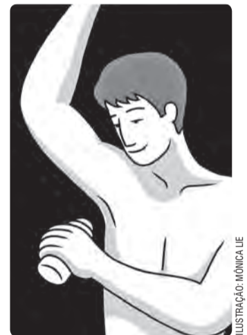
ILUSTRAÇÃO: MÔNICA LIE

Para entender melhor a diferença entre o DESODORANTE e o antitranspirante, também conhecido como antiperspirante, é preciso saber que o suor não cheira mal. Na verdade, as BACTÉRIAS que se alimentam dele produzem ÁCIDOS carboxílicos, com AROMA bastante desagradável. Nesse caso, os desodorantes perfumam, tentando mascarar os ODORES com fragrâncias diversas. Alguns contêm também bicarbonato de SÓDIO , que reage com os ácidos carboxílicos, produzindo SAIS sem CHEIRO . Esse produto surgiu no fim do século XIX, nos Estados Unidos, e, antes disso, cada POVO disfarçava o fedor das AXILAS de uma maneira. Os ROMANOS , por exemplo, colocavam almofadas cheirosas após o BANHO , e os EGÍPCIOS se banhavam com ÓLEOS , gorduras e SABÕES aromatizados. Já o antitranspirante apresenta em sua composição sais de alumínio, que fecham temporariamente as glândulas sudoríparas (produtoras de SUOR ), inibindo a transpiração. De forma geral, ambos costumam ter AÇÃO bactericida, que também combate o mau cheiro.