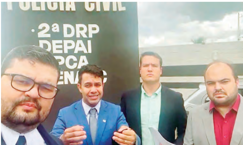
Representantes da OAB de Aparecida durante a entrega do ofício na Polícia Civil