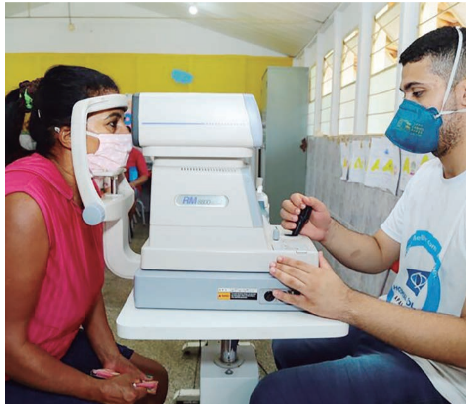
Prefeitura de Aparecida atenderá a população hoje e sábado (12), na Escola Municipal São Francisco de Assis, oferecendo centenas de serviços de saúde, de assistência social, de acesso a emprego e até recreação para as crianças

Além de aproveitar os mais de 130 serviços gratuitos que serão prestados pela Prefeitura de Aparecida aos moradores nesta sexta (11) e sábado (12), das 8h às 13h, na Escola Municipal São Francisco de Assis, no Jardim Alto Paraíso, dentro do 29º Prefeitura em Ação, o público poderá aproveitar o mutirão para adotar um pet, gato ou cachorro.