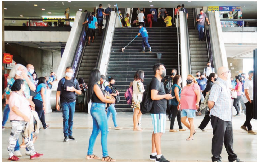
Rodoviária do Plano Piloto: liberação do uso de máscara ocorre em meio à queda na taxa de transmissão do coronavírus no DF e ao avanço da vacinação

DA REDAÇÃO - O anúncio foi feito pelo governador Ibaneis Rocha durante agenda pública no Palácio do Buriti. O decreto que extingue a obrigatoriedade foi publicado em edição extra do Diário Oficial do Distrito Federal (DODF).