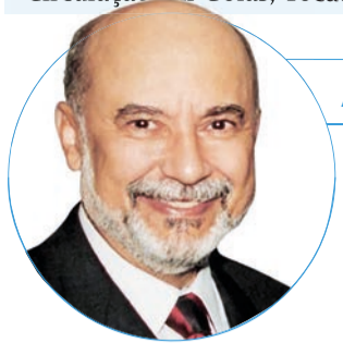
■ Paiva Netto