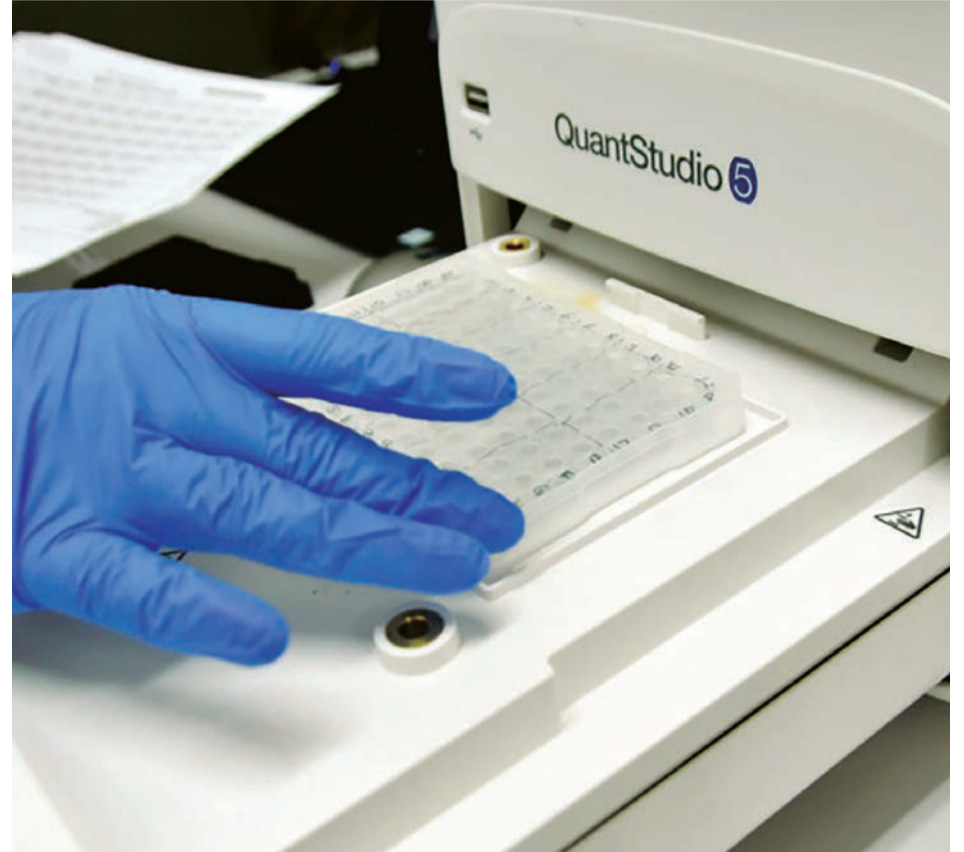
Trabalho da equipe ajuda a subsidiar decisões da Gestão Pública

DA REDAÇÃO - O Laboratório Central de Saúde Pública do Tocantins (Lacen-TO) divulgou relatório dos resultados parciais, referentes ao sequenciamento de amostras de SARS-CoV-2 positivas, feito 100% pela equipe tocantinense. O trabalho foi realizado no último dia 25 de fevereiro e analisou 95 amostras, selecionadas entre os dias 8 e 15 do mesmo mês, em 31 municípios diferentes.