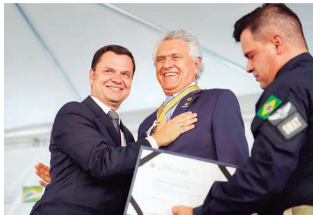
Governador Ronaldo Caiado durante inauguração da nova sede administrativa da PRF em Goiás: integração entre polícias promove celeridade no combate à criminalidade