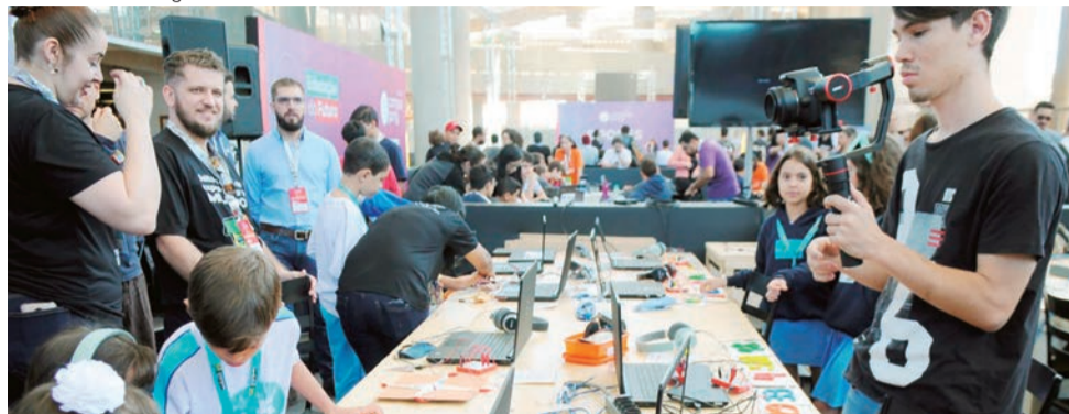
A Campus Party foi realizada em Brasília pela última vez em 2019, quando reuniu mais de 100 mil pessoas no Mané Garrincha

DA REDAÇÃO - Começa hoje a 4ª edição da Campus Party Brasília (CPBSB4). Realizado em formato híbrido, o evento prossegue até o dia 27, com atividades presenciais no Estádio Mané Garrincha e outra parte online. Também nesta quarta, às 9h30, no estádio, a Secretaria de Ciência, Tecnologia e Inovação (Secti) fará a coletiva de imprensa de abertura da CPBSB4.