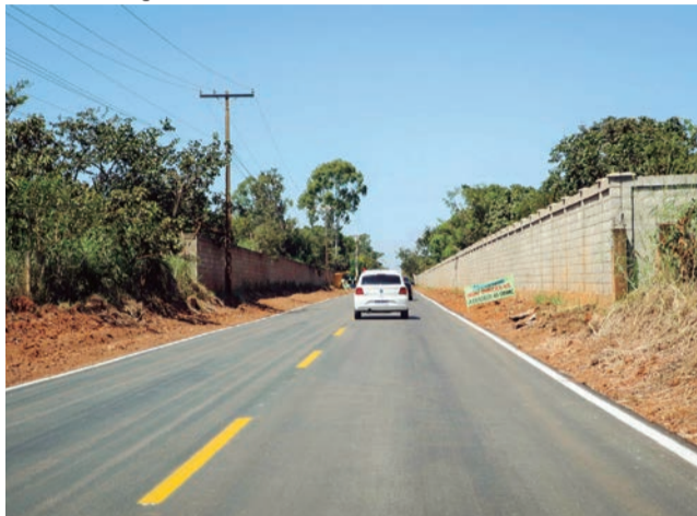
A pavimentação das pistas da Estrada São Bartolomeu e da Via das Harpias teve investimento de cerca de R$ 2 milhões

trito Federal (DER-DF) tem ainda 20 projetos de acessos elaborados aguardando recursos para asfaltar mais 150 km. Até agora, foram investidos R$ 57 milhões no Caminho das Escolas.