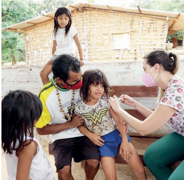
Ação na comunidade Guajajara, que está localizada no Noroeste

cerca de 170 pessoas. Originários da Venezuela, eles buscam no Brasil melhores condições de vida. Eles migraram para cá em decorrência da falta de assistência em saúde e vulnerabilidade no país de origem. Na região do Noroeste, vivem cerca de 200 pessoas dos povos Guajajara, Fulni-ô, Tuxá e Kariri-Xocó em área equivalente a 32 hectares e a UBS de referência é a 114/115 Asa Norte.