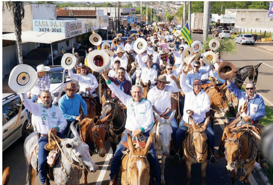
Governador Ronaldo Caiado durante o 14º Encontro Nacional de Muladeiros, em Iporá, quando foi lançado o Passaporte Equestre

Passaporte Equestre é uma iniciativa que garante agilidade, menos burocracia e maior economia para transporte de equinos