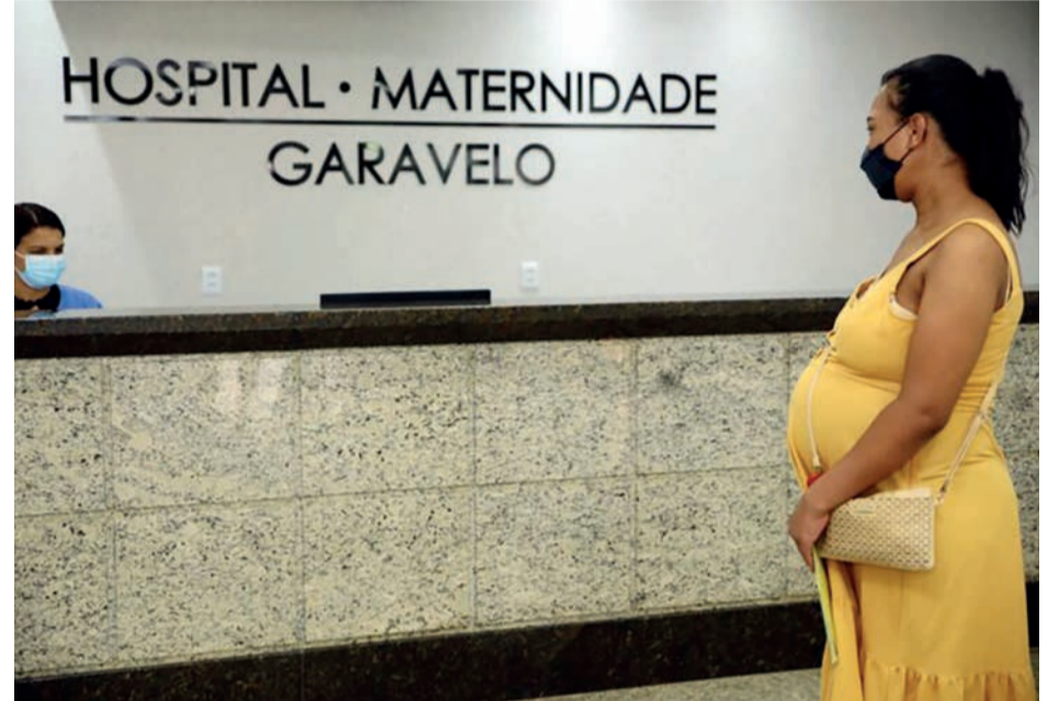
Gestantes da cidade já podem procurar diretamente o Hospital, que foi contratado pela Secretaria de Saúde para realizar partos e atendimentos de emergências ginecológicas e obstétricas

A Secretaria de Saúde de Aparecida (SMS) inicia hoje, quarta-feira, 20 de abril, a oferta de atendimentos 24h para gestantes no Hospital Maternidade Garavelo (HMG), instituição contratada pela pasta. Com isso, as grávidas da cidade ganham um novo local totalmente "porta aberta" (sem necessidade de encaminhamento) para atendimento emergencial em ginecologia e obstetrícia via Sistema Único de Saúde (SUS). Assim, as interessadas podem procurar diretamente o Hospital sem precisar passar anteriormente por alguma outra unidade.