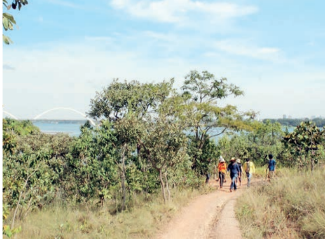
O Parque Distrital das Copaibas, no Lago Sul, possui uma trilha sinalizada de 4,2 km: turista tem acesso a poços, nascentes e uma pequena cachoeira

Península Sul, na SHIS QL 12 do Lago Sul, e o Anfiteatro Natural do Lago Sul, na SHIS QL 14. A unidade do anfiteatro, mais conhecida como parque Asa Delta, permite fácil acesso à margem do lago e possui um morro artificial construído na década de 1980 para a prática do voo-livre, esporte com tradição na capital, e para fotografias de tirar o fôlego. Já a Península Sul agracia os visitantes com uma trilha que margeia a unidade, além de vários píeres no lago artificial brasileiro.