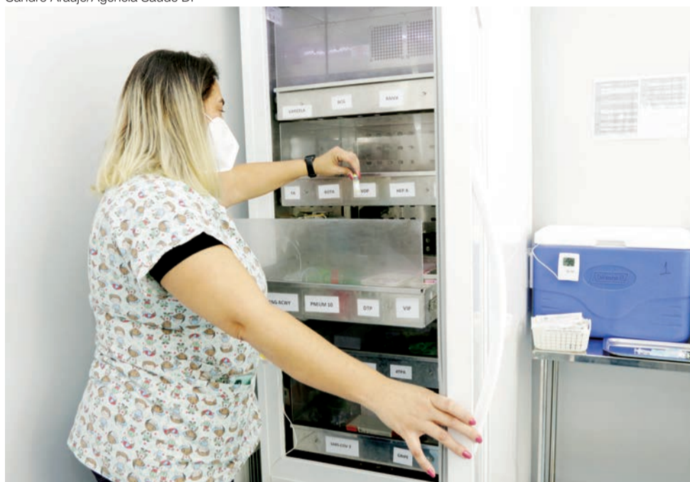
Os imunizantes contra HPV estão disponíveis nas salas de vacinação de rotina no DF

DA REDAÇÃO - Com a disponibilidade de doses residuais da vacina contra o HPV, a Secretaria de Saúde (SES) autorizou a aplicação de doses em meninas e mulheres de 9 a 45 anos e em meninos e homens de 9 a 26 anos de idade. Os imunizantes estão disponíveis nas salas de vacinação de rotina.