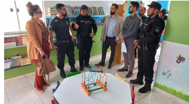
Representantes da Secretaria de Administração Penitenciária da Paraíba (Seap) conhecem espaço preparado para que detentos recebam os filhos em São Luís de Montes Belos