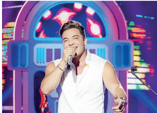
Show de Wesley Safadão será no dia 12 de maio, no Sindicato Rural de Palmas

nacional, Wesley Safadão é uma referência no gênero musical forró. Iniciando sua carreira na banda Garota Safada, fez muito sucesso no Norte e no Nordeste em meados dos anos 2000, não demorando muito a se popularizar em todo o Brasil.