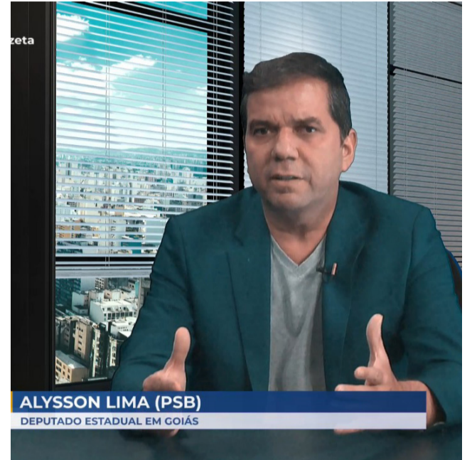
Ele luta contra os aumentos abusivos do IPTU, IPVA, ICMS

Sobre o cenário político ele vê que Caiado está longe de ser reeleito, após os consecutivos fechamentos dos comércios na pandemia, isso teve um abalo para a economia que até hoje a população está sentindo os efeitos com alta em todos os setores, as vaías em Rio Verde foram um “divisor de águas” que mostra que o