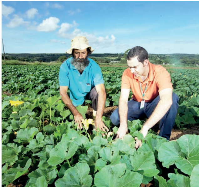
Profissionais ligados à extensão rural são o público-alvo do congresso