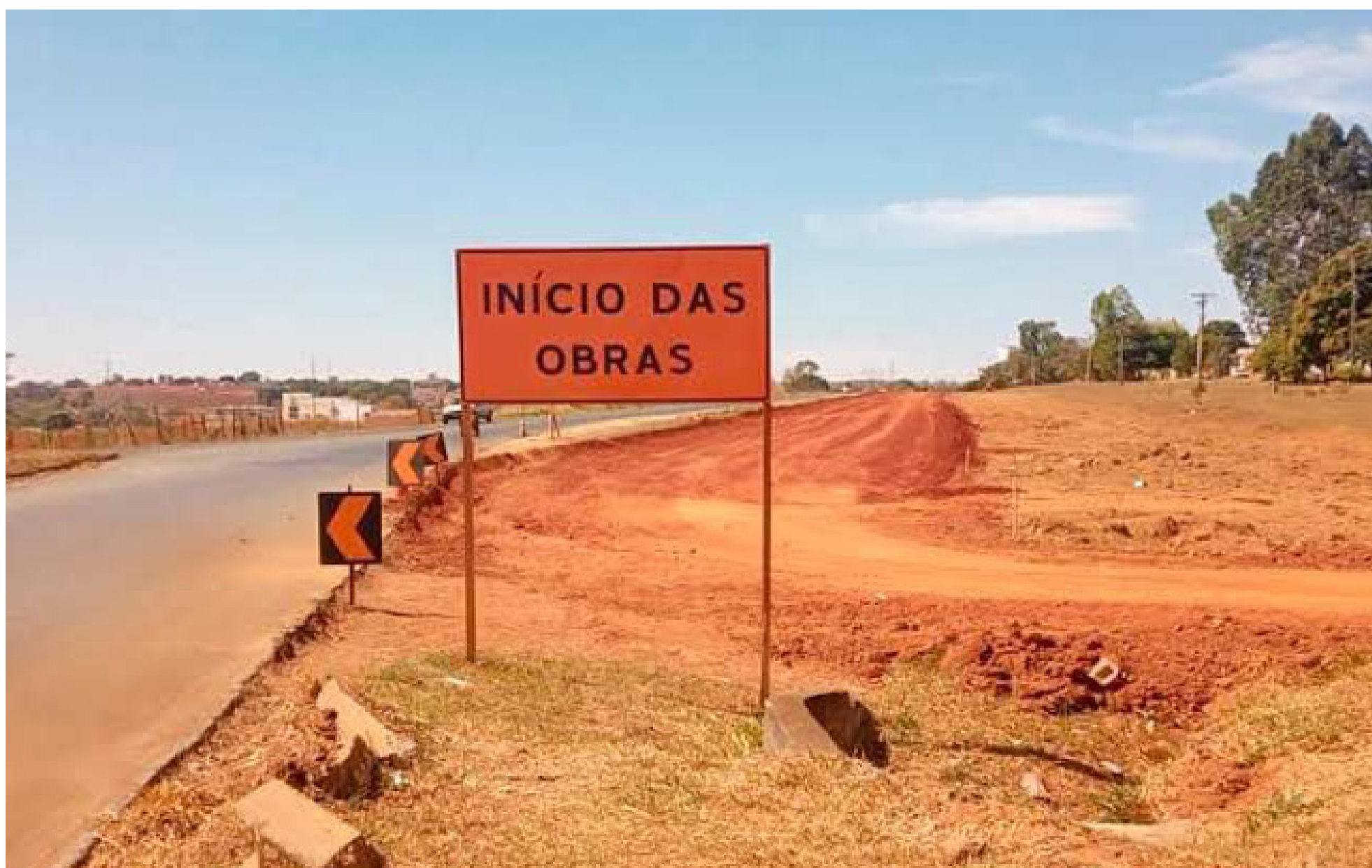
GO 010 obra inacabada

zembro de 1987, criando o município de Bonfinópolis, desmembrado do município de Leopoldo de Bulhões. Pelo Processo nº 1.264/85 ficou concretizada a criação e finalmente a Lei foi publicada no Diário Oficial de 27 de janeiro 1988.