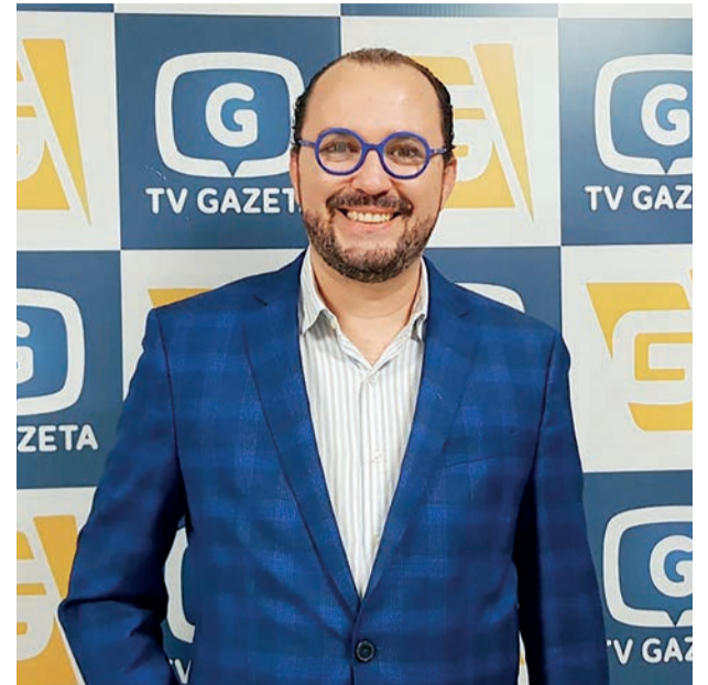
O contador foi um dos convidados do Jornal da Gazeta Edição do Almoço

"Todos os mecanismos que a própria receita oferece para que o contribuinte obtenha algum desconto, ela tem controle. Então, nesse caso temos, as instituições de ensino que são obrigadas a fazer a declaração específica informando quem são seus alunos, as atividades médicas hospitalares, que esses