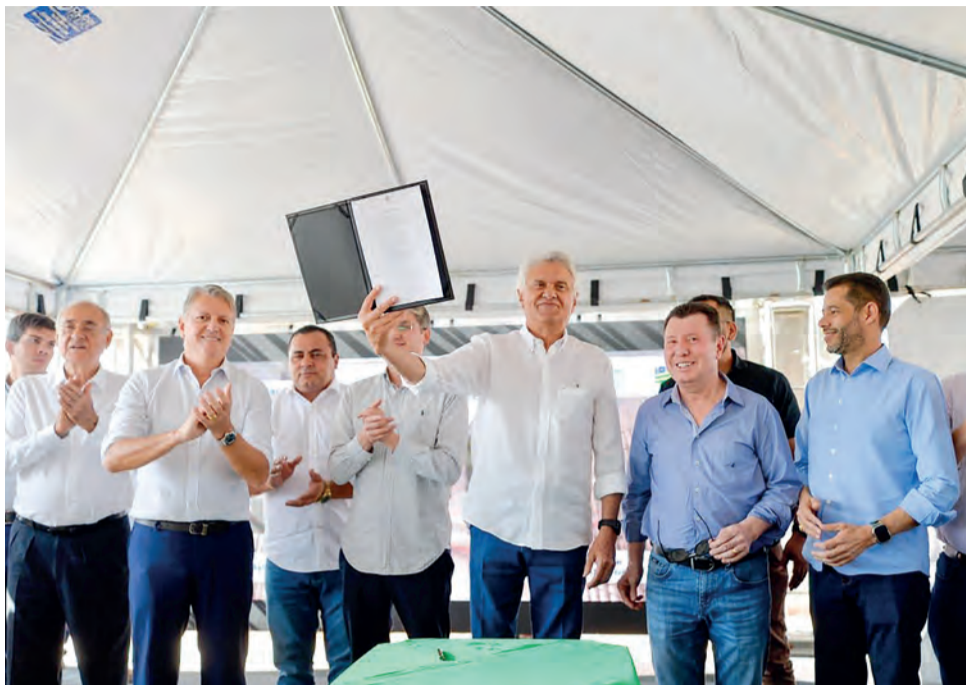
Assinatura da ordem de serviço do Mercado Goiano

“Esse mercado vai ser referência. Aqui vai se trabalhar de domingo a domingo e vocês vão ver a autoestima dos feirantes”, sublinhou o governador Ronaldo Caiado. “Teremos uma outra realidade, mais renda e muitos fregueses,