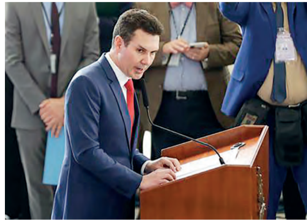
Ministro das Cidades, Jader Filho, na cerimônia de assinatura do projeto de lei que cria o novo programa Minha Casa, Minha Vida

Tanto as faixas de renda para beneficiários, como o valor a ser financiado foram ampliados. Com isso, a Faixa 1 do programa con-