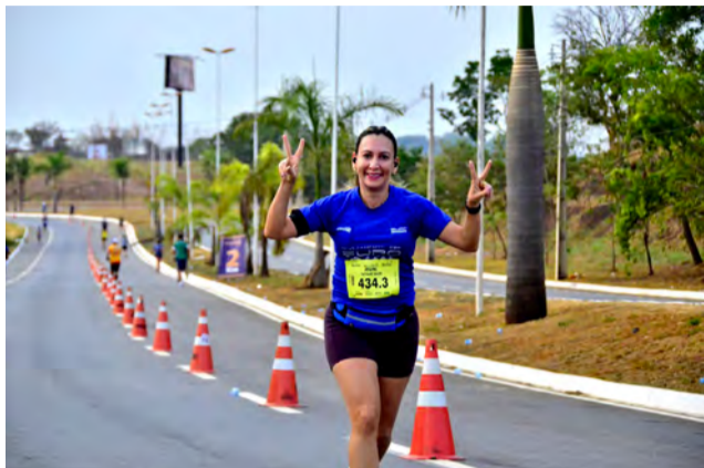
Corrida Euro Run de 2022