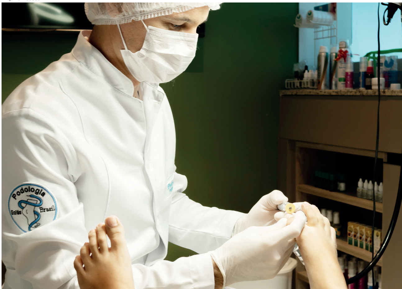
Segundo Pedro Matos, nos pés diabéticos a podologia trabalha na intenção primária, prevenindo infecções, úlceras e amputações