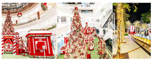
FLAMBOYANT SHOPPING CENTER - A decoração do Flamboyant traz a Fábrica de biscoitos, tremzinho, Samba Baloon, Presépio e a casa do Papai Noel