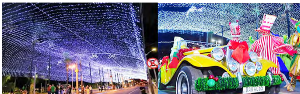
PRAÇA TAMANDARÉ - Além do tradicional Túnel do Tempo está toda decorada com caixas de presentes, Casa do Papai Noel, boneco de neve