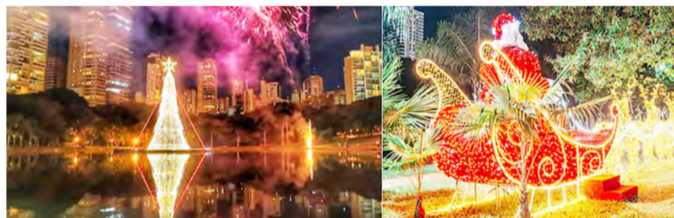
DECORAÇÃO DO PARQUE VACA BRAVA - Decoração com a terceira maior árvore flutuante do Brasil, instalada no meio do lago do parque