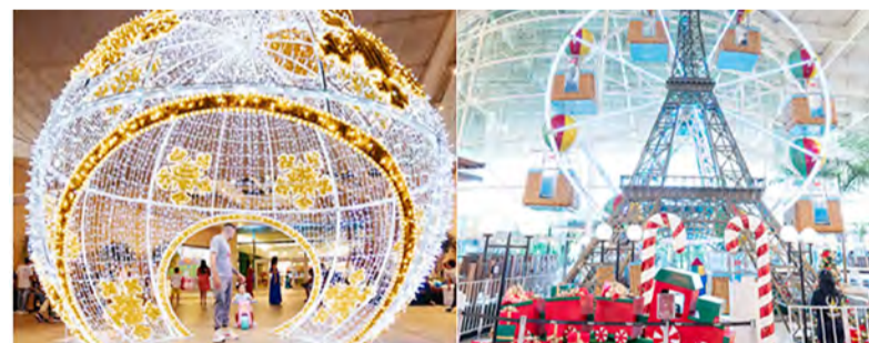
PASSEIO DAS ÁGUAS SHOPPING - Conta com uma incrível vila de brinquedos, o trono do Papai Noel e uma roda gigante dentro do shopping