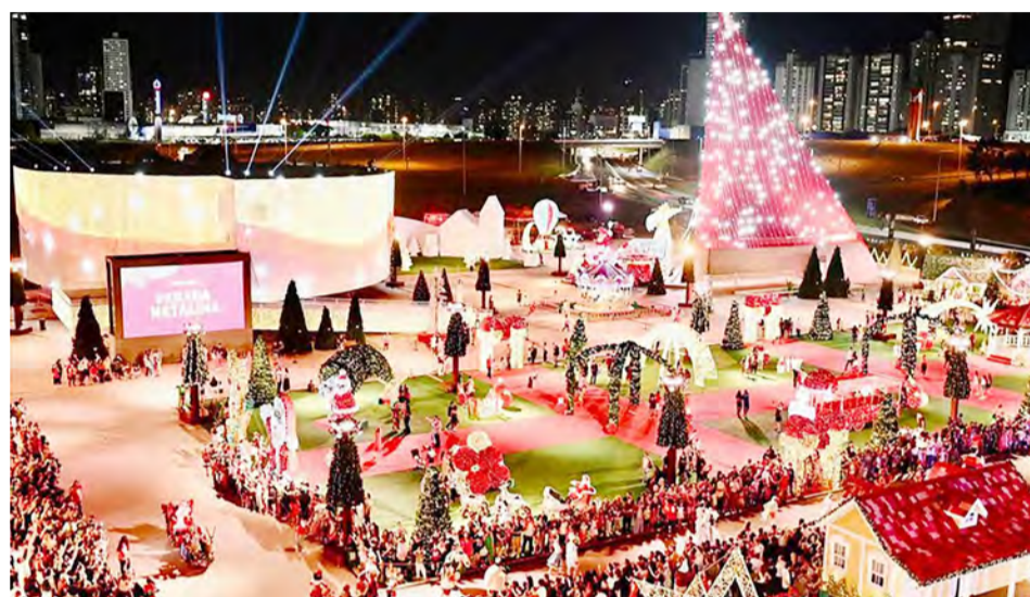
NATAL DO BEM - No Centro Cultural Oscar Niemeyer