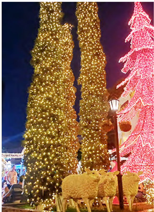
POLO IMÓVEIS - A visitação gratuita. Tem um “tremzinho” no local, oferecendo passeios para crianças por R$20 ou 3kg de alimentos não perecíveis