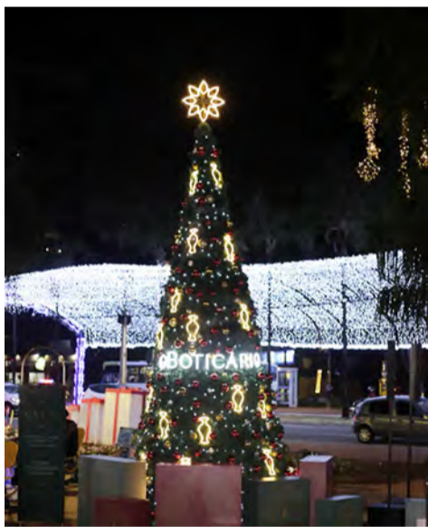
ÁRVORE DE NATAL DE O BOTICÁRIO NA PRAÇA TAMANDARÉ - Ambiente instagramável, com estrutura natalina em um cenário com moldura decorada e, ao acionar um botão, o letreiro com a frase “espalhe amor” acende as luzes e bolhas de sabão perfumadas começam a surgir