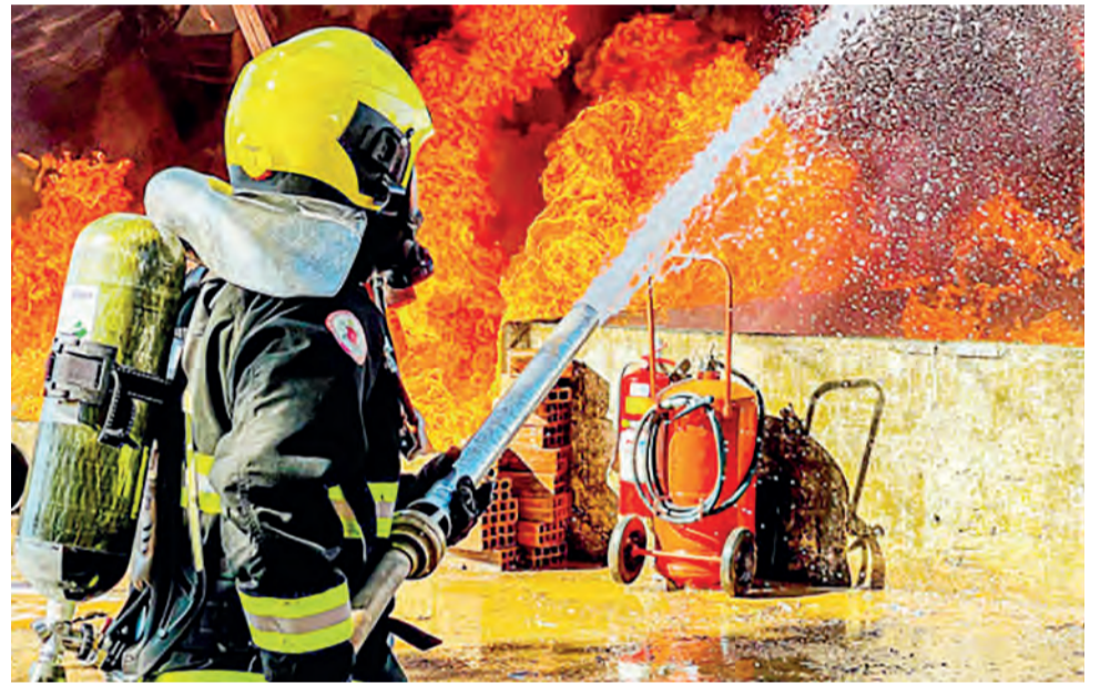
Bombeiros militares em combate a incêndio florestal em Taquaruçu Grande, em Palmas

O Corpo de Bombeiros Militar do Tocantins (CBMTO) está encerrando 2023 celebrando 31 anos de criação, comemorados no último dia 14 de dezembro, com uma série de conquistas que beneficiam a população tocaninense. O governador Wanderlei Barbosa participou da solenidade de aniversário, destacando investimentos em equipamentos, veículos e infraestrutura, além do expressivo número de 22.450 atendimentos realizados ao longo do ano.