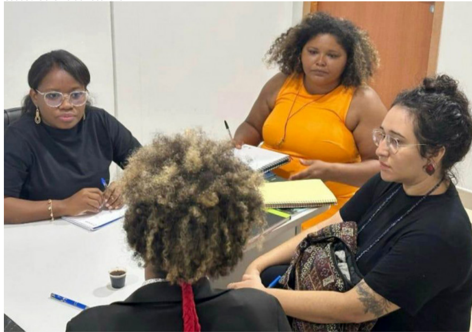
Reunião busca viabilizar de forma coletiva e integral o acesso de saúde à população quilombola do Tocantins

A Secretaria de Estado da Saúde do Tocantins (SES-TO) participou de uma reunião em conjunto com a Secretaria dos Povos