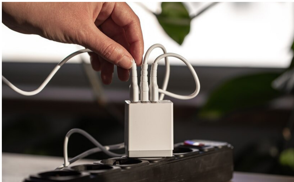
A falta de um projeto elétrico, materiais de baixa qualidade e instalações elétricas mal dimensionadas são algumas das escolhas ruins que podem ocasionar acidentes graves