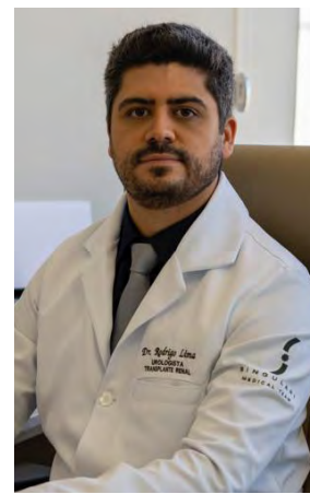
Dados da Sociedade Brasileira de Urologia demonstram que a incidência da doença nessa época aumenta, em média, 30% na comparação com outros períodos do ano. Médico Urologista explica que mudanças de hábitos durante as férias, como menos ingestão de água e maior consumo de álcool, favorecem a maior ocorrência do problema

Ele também diz que fatores naturais, doenças genéticas também estão relacionados a um risco maior da pessoa desenvolver cálculos renais, além do próprio histórico familiar. “Quem tem parentes com pedras nos rins deve ter mais atenção e fazer exames para descobrir se também pode apresentar a doença”, completa o urologista. O médico ainda acrescenta que a incidência da doença é maior entre adultos jovens, espe-