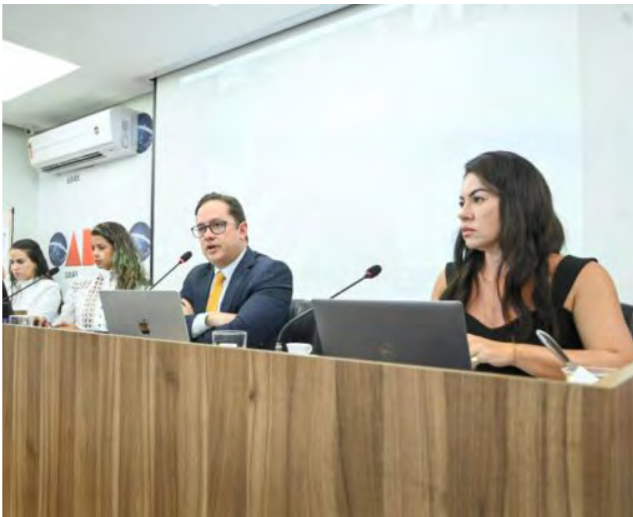
Pacote de sugestões foi definido após audiência pública na OAB-GO