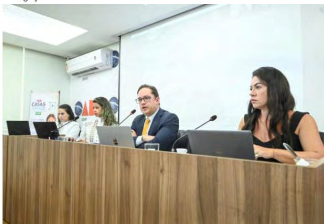
Pacote de sugestões foi definido após audiência pública na OAB-GO

Audiência pública híbrida contou com participação de advogados eleitorais, institutos de pesquisa, servidores e juizes eleitorais