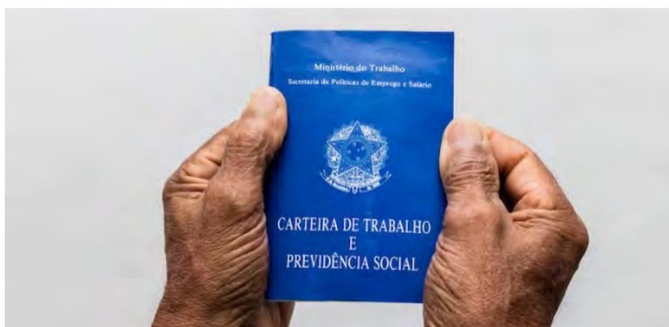
A chamada revisão da vida toda sobre o cálculo da aposentadoria foi cancelada pelo STJ

Em 2022, o plenário do STF havia decidido pela constitucionalidade da revisão da vida toda. Contudo, agora, o tribunal entendeu que os segurados não têm direito de opção, mesmo que a